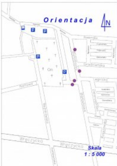
Cmentarz Komunalny ul. Radomska