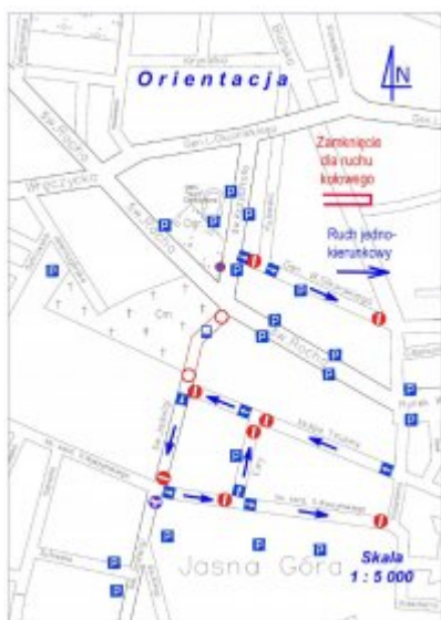
Cmentarz ul. Rocha